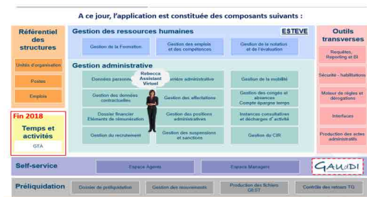
Couverture fonctionnelle de RenoIRH Vue générale

→ Le processus de versement indemnitaire manque de souplesse et devrait pouvoir être au moins hebdomadaire. Le projet du ministère souhaite passer d'une à deux fois par mois mais, là encore, le système resterait insuffisant. Il nous est répondu qu'il s'agit d'une situation transitoire, l'objectif étant d'aller jusqu'à des versements quotidiens.