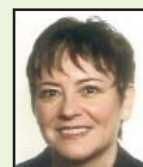
par Arlette Lemaire

Les collègues ont conforté la place du SNASUB lors des élections professionnelles dans l'ASU, parce qu'ils savent qu'il est indispensable de se battre pour conserver et renforcer les garanties individuelles et collectives liées au statut de fonctionnaire d'Etat, garant de l'égalité et indispensable à un service public d'Education nationale de qualité.